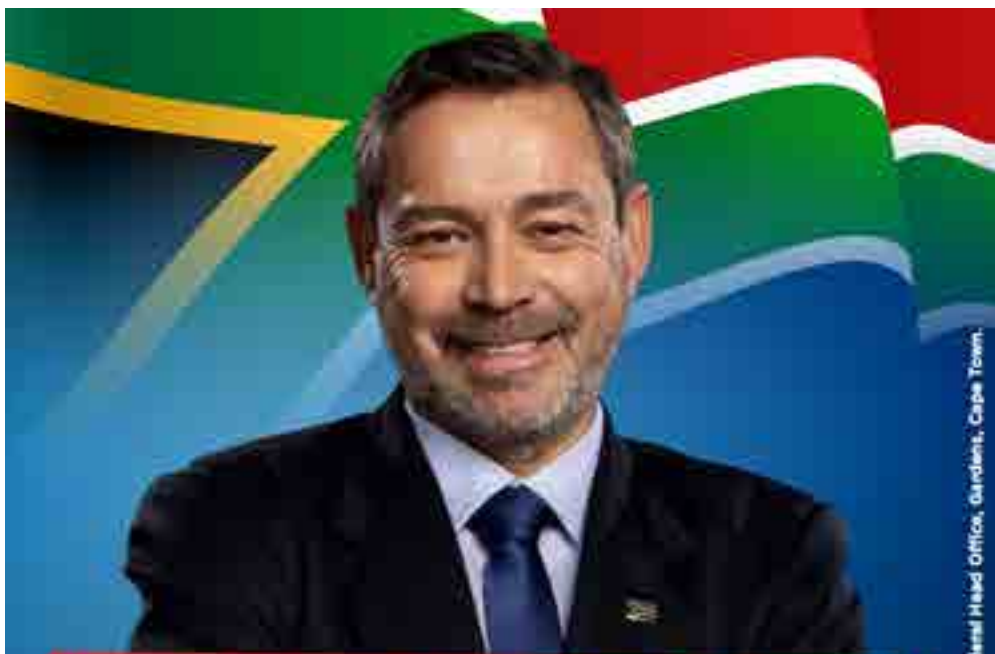
Issued and printed by Greg Krumbok, DA Federal Head Office, Garden of Eden, Cape Town.