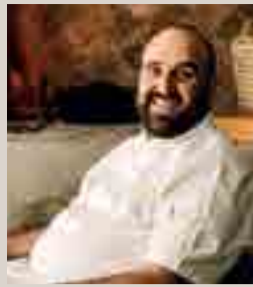
Pasch du Plooy

Add the egg whites, sugar, salt and vanilla into a heat-proof bowl and set over a saucepan with simmering water. Whisk continuously until the sugar has melted, about 3-5 minutes. Once melted, add the mixture to a bowl of a stand mixture fitted with a whisk attachment. Beat at medium-high speed for 10 minutes until stiff peaks. It must be thick and glossy. Fill a piping bag with the preferred nozzle and pipe the meringue onto each tart. Torch the meringue until toasty.