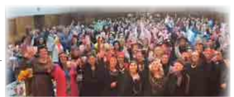
Op die foto van die lede van die Huppel Trippel Klub in Heilbron.