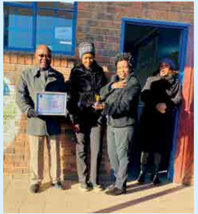
Phitshana Public School obtained certification of excellence in Art.