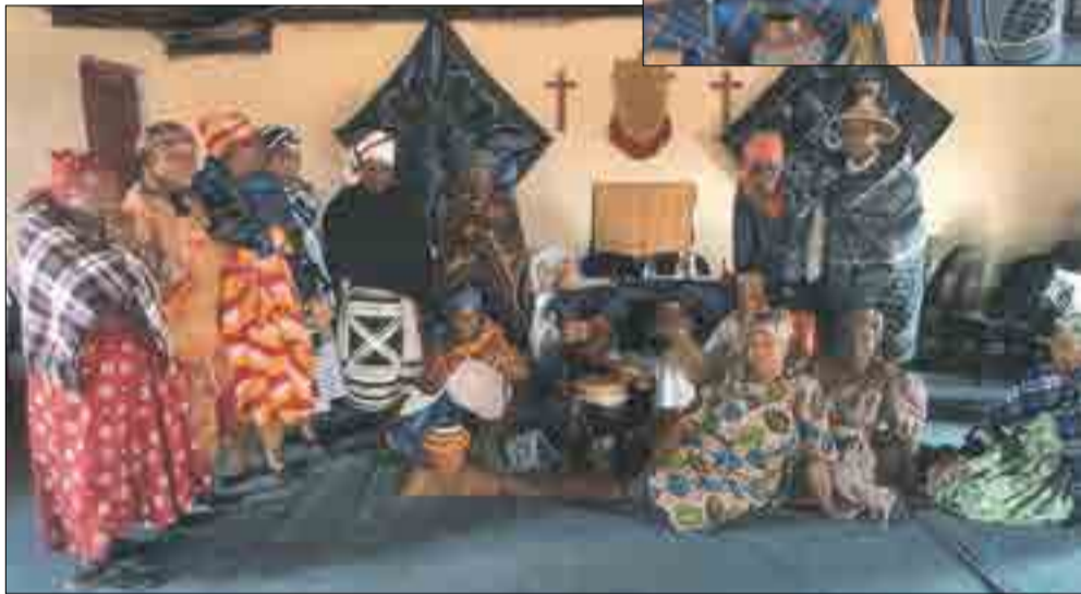
Bethel Reformed Church Heilbron congregation celebrating Heritage month led by old Rev Mohlamme.