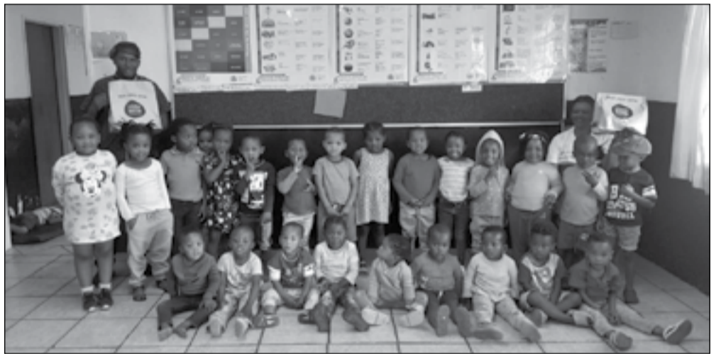
Tydens Debonairs se "Dough Nation" projek het die bestuurder en sy span die kinders van Tinkinkie en Good Hope Edu & Aftercare bederf met 'n heerlike eet ding. Die kinders het dit opreg geniet en was baie dankbaar vir die groot bederf.