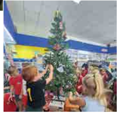
Kleuterkasteel het Vrydag 'n spesiale draai by Heilbron Herald gemaak, om ons te help om ons kersboom pragtig te versier, vir die kersboom-projek. Die pienkvoete se versierings laat die boom ekstra spesiaal lyk!