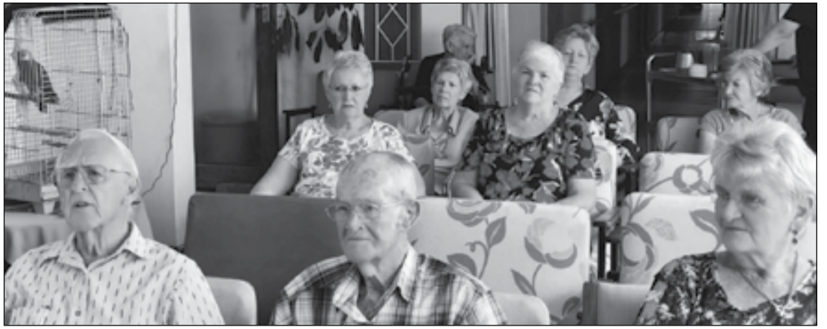
'n Paar lede dink diep aan voorstelle om die nuwighede wat in die vooruitsig is, te maak werk.