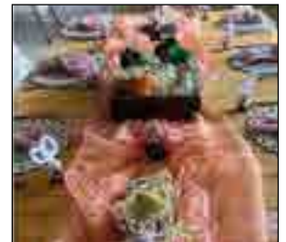
Die oggend is op 'n hoë noot afgesluit by 'n pragtige gedekte paasfees tafel met heerlike filo-geregte.